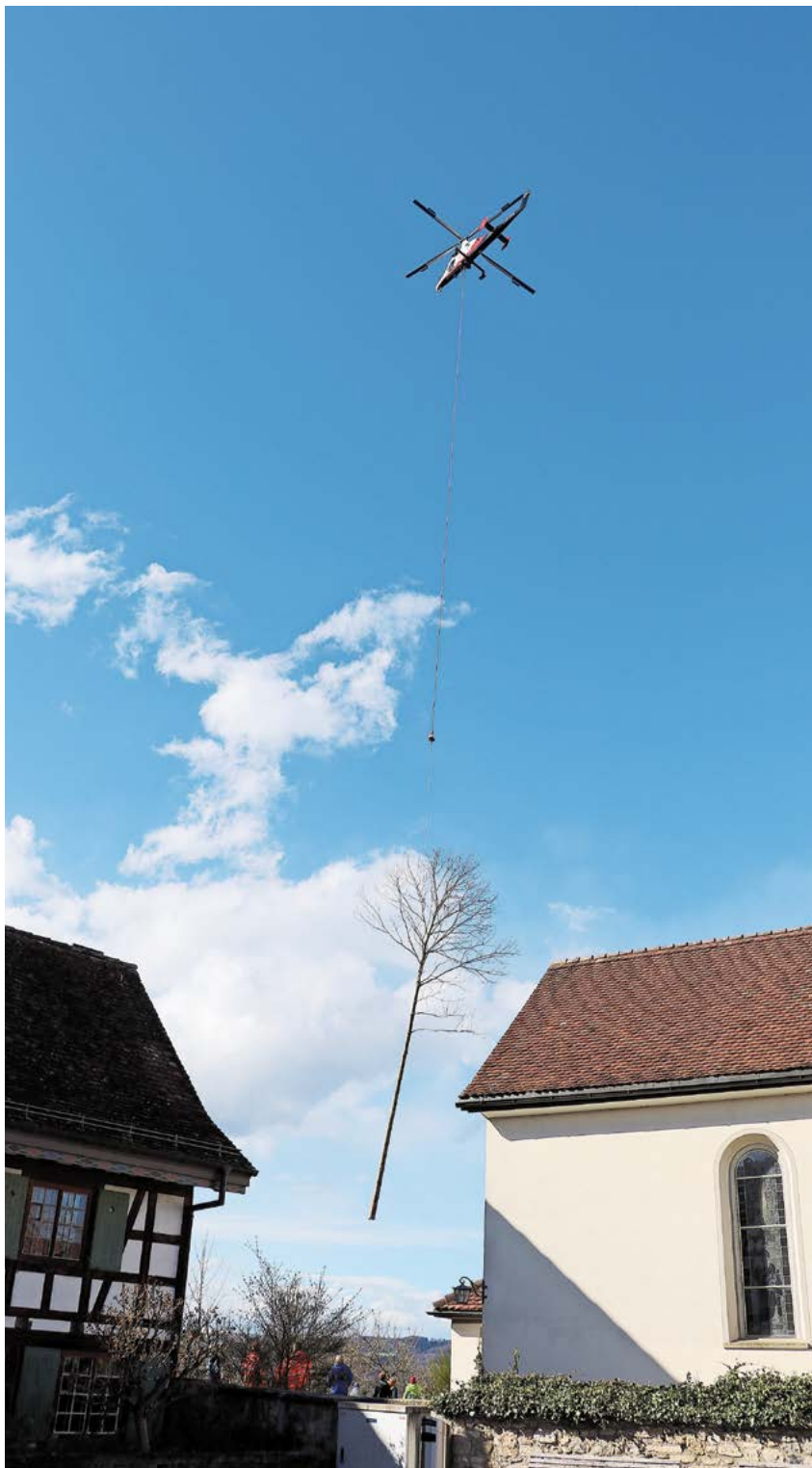
Das Wetter spielte mit: Der Holzschlag erfolgte im Tobel des Altenbachs. Die Kirche gleich oberhalb war ein beliebter Beobachtungsplatz für Schaulustige.